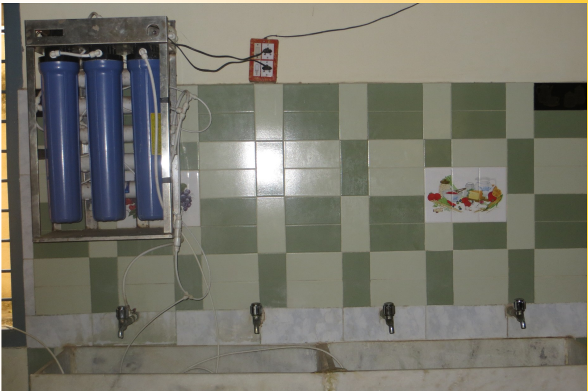
Madurai, nieuwe waterzuiveringsinstallatie.