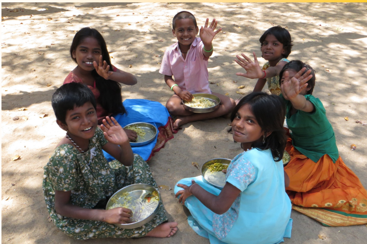
Madurai, februari 2013.