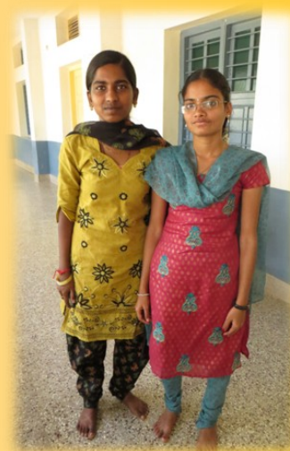
Foto 3. Hallelujah Children Home, Madurai, februari 2013.