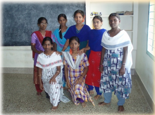
Foto 1. Hallelujah Children Home, Madurai, april 2007