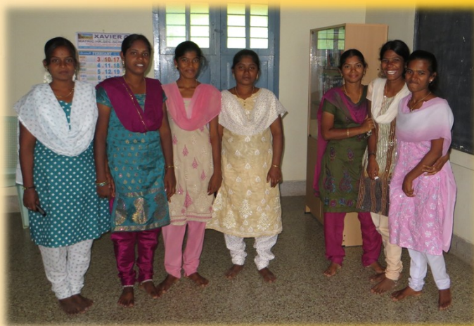
Foto 2. Hallelujah Children Home, Madurai, februari 2013.