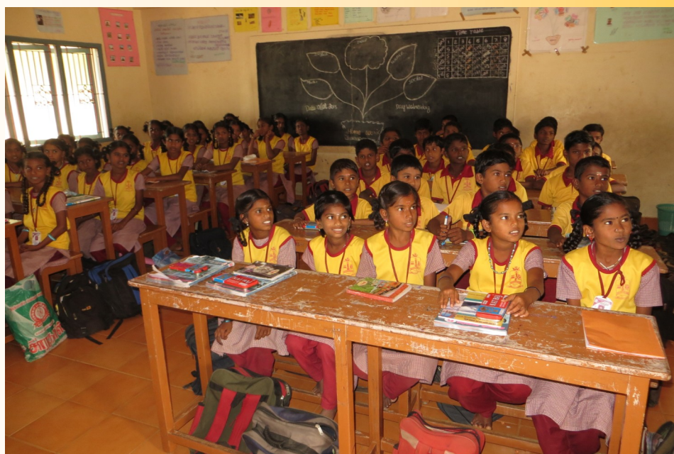
Trichy, februari 2013.

Omdat wij dromen van een wereld waarin jongens en meisjes dezelfde ambities mogen hebben.