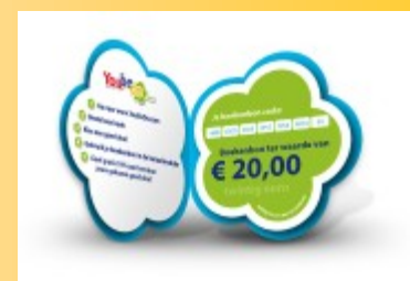
Voorbeeld boekenbon van YouBeDo.com

“Wij geloven dat - net als bij het delen van geluk - je er samen beter van wordt als je deelt. YouBeDo.com doneert daarom 10% van het aankoopbedrag aan een goed doel dat de klant zelf kiest. De donatie wordt berekend over het aankoopbedrag exclusief btw. Aan het begin van iedere nieuwe maand worden de donaties aan de goede doelen overgemaakt. Daarnaast sturen we maandelijks een nieuwsbrief met daarin het overzicht van de gedoneerde bedragen.”