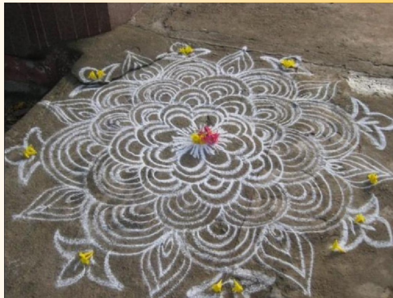
Rangoli, gemaakt door de kinderen van het Hallelujah Children Home in Madurai. Rangoli's worden gemaakt van gekleurde poeders en getekend op de stoep voor een voordeur om mensen te verwelkomen.