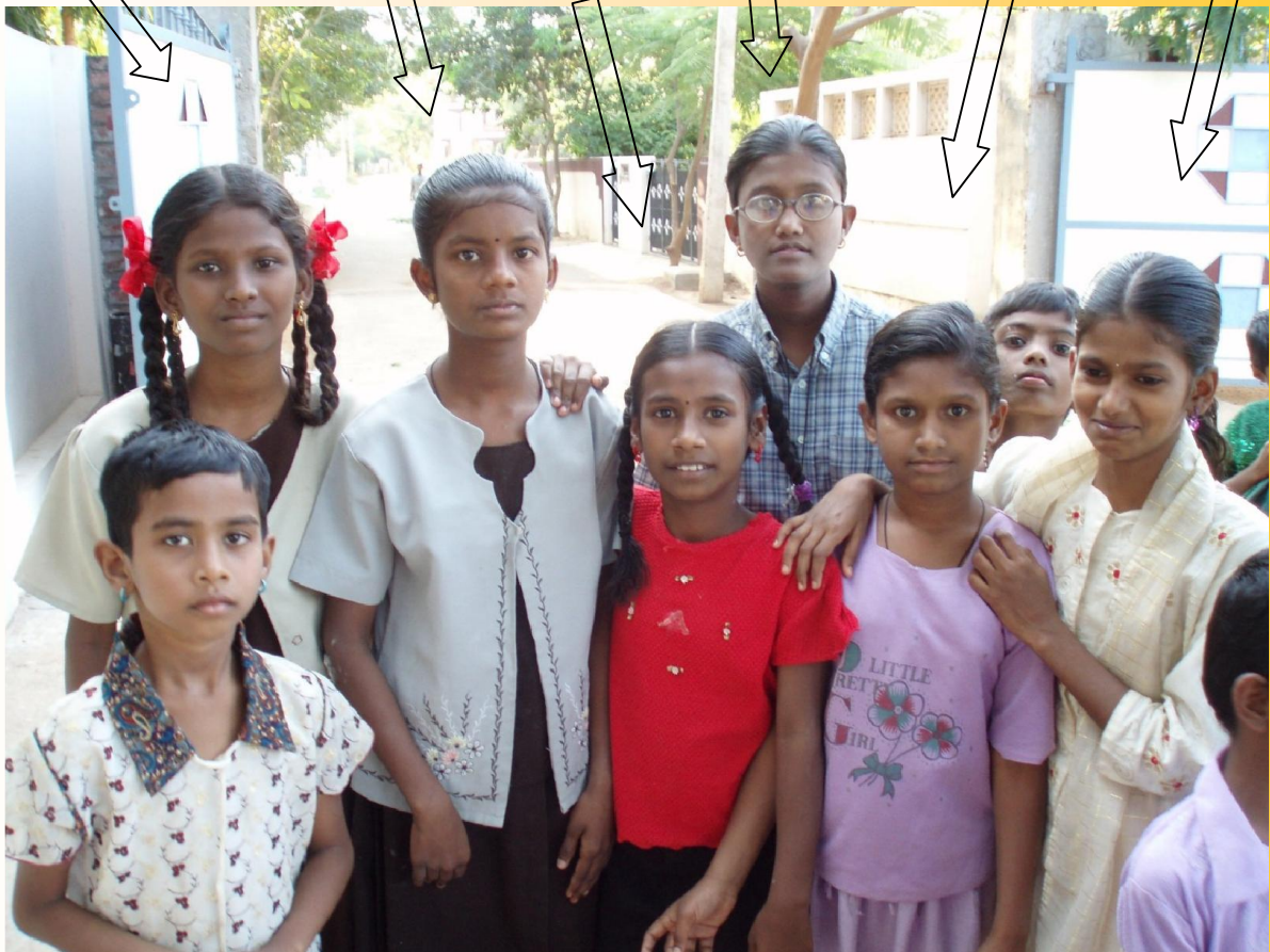
Hallelujah Children Home, Madurai, 2007

Omdat wij dromen van een wereld waarin jongens en meisjes dezelfde ambities mogen hebben.